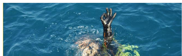
Nitrox Diver ** EUR 130,00

* A Ustica l'accesso nelle grotte non è consentito se non si è in possesso di una certificazione cavern/cave.