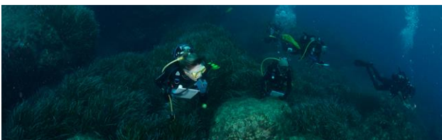
Naturalist or Fish Identification Diver - EUR 100,00