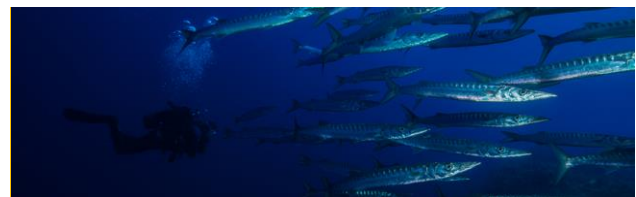
Deep Diver EUR 130,00